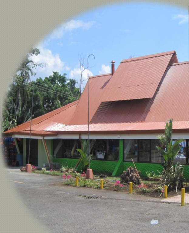
CLUB LA GLORIA, ALAJUELA 2011

CLUBES, BARES, SALONES, FABRICAS Y OTROS