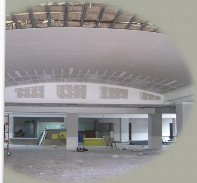
CLUB ALIANZA, ALAJUELA 2011-2012